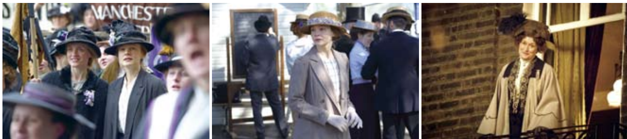
監督：サラ・ガヴロン 2015年イギリス製作

女性には参政権も親権さえも認められていなかった1912年のイギリス。ロンドンでは、当時の政権に対して女性の選挙権を要求する運動が先鋭化していた。50年に及ぶ平和的な抗議が黙殺され続け、カリスマのリーダーであるエメリン・パンクハーストが率いるWSPU(女性社会政治同盟)は、“言葉より行動を”と過激な抗争を呼びかけていた。その一方で人を傷つけないことを方針のひとつとする穏健派も存在した。現代社会の深刻な問題となっているテロ行為とは一線を画す、理性に拠る活動だったことが知られている。階級を超えて連帯した女性たちの願いはやがて大きなムーブメントとなり社会を変えていった。——実話に基づく本作は、そんな女性たちの勇気ある行動を描出した感動作だ。